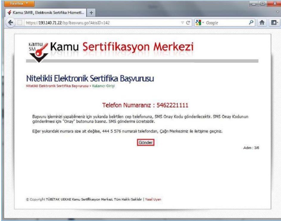
Şekil 3 - SMS Onay Kodu Gönderim Ekranı

Form onaylandıktan sonra SMS Onay Kodu gönderim ekranı (Şekil 3) görüntülenecektir. Başvuru formunu doldururken Cep Telefonu alanına girdiğimiz Cep Telefonu numarası görüntülenir. Gönder butonuna basıldığında ekranda görüntülenen cep telefonu numarasına SMS Onay Kodu gider.